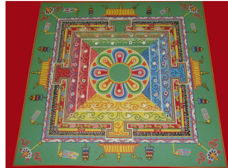
Medizin-Buddha-Mandala (in Arbeit)